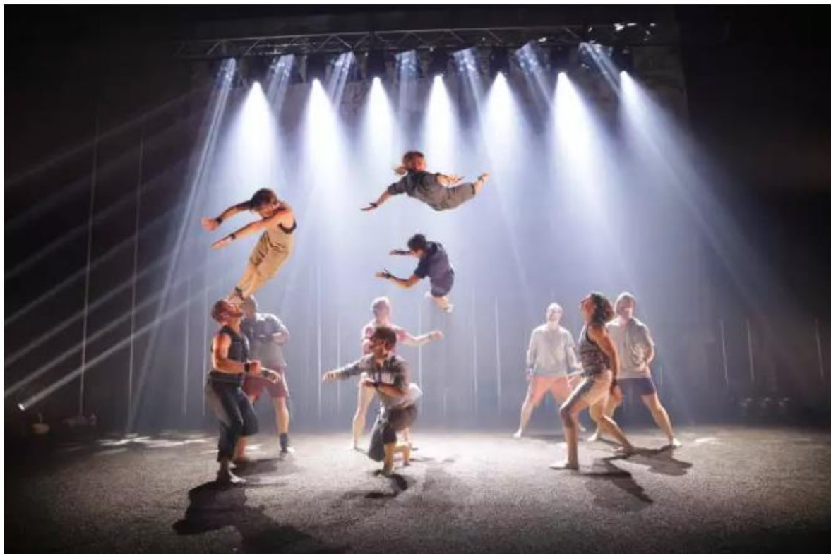
« Backbone », par la compagnie australienne Gravity & Other Myths.

Ils sont debout côte à côte en bord de scène, tenant à bout de bras devant eux d'énormes pierres. L'un après l'autre, ils lâchent leur fardeau et filent dans les coulisses. Rapidité de la chute pour rappeler l'irrésistible attrait du sol. La pesanteur a parlé dans un fracas de caillasses. La résistance humaine pour contrer la gravité ne dure qu'un temps. En une séquence finale, la troupe australienne Gravity & Other Myths (GOM) a nommé son désir d'alléger le monde et signé son sidérant spectacle Backbone (« colonne vertébrale »), à l'affiche jusqu'au 29 décembre, de la Grande Halle de La Villette.