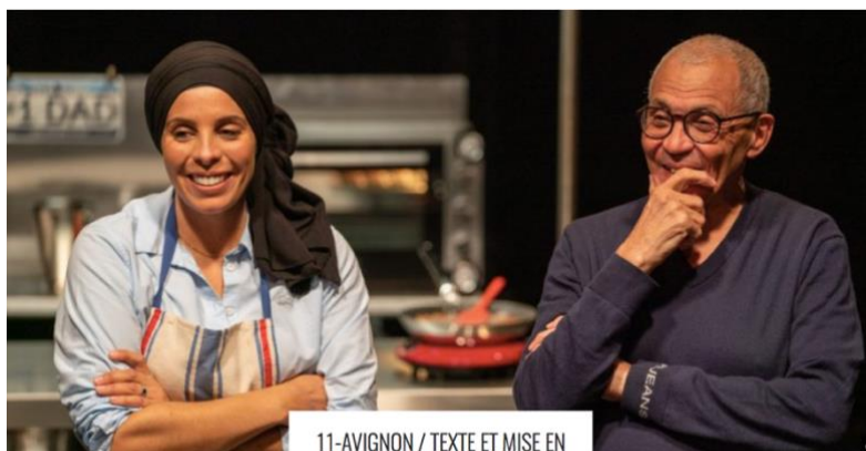
11-AVIGNON / TEXTE ET MISE EN SCÈNE D'AHMED MADANI